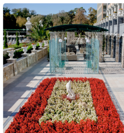
Просторната градина на Хотел Астор Гардън