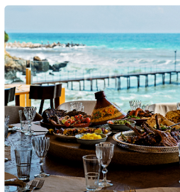
The Bay – където небето целува морето