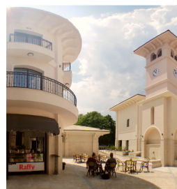
Raffy Bar & Gelato В Приморски център