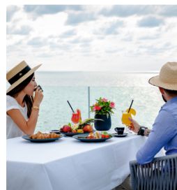
Открита тераса в ресторант Villa Chinka